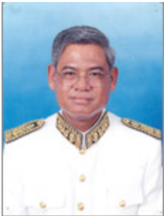
Sar Kheng Ministre de l'Intérieur