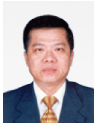
Teng Savong Secrétaire d'Etat à la Sécurité