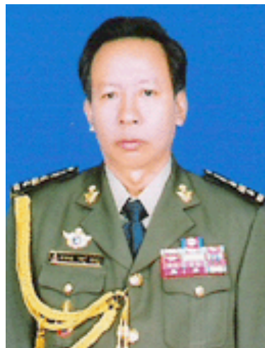
Tea Banh Ministre de la Défense