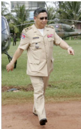
Hok Lundy Directeur de la Police (décédé le 9/11/2008)